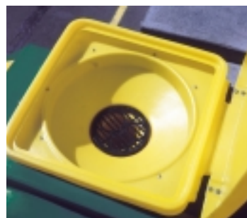
Entonnoir de 20 litres avec filtre intégré et couvercle